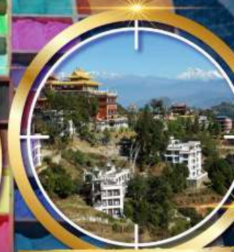
วัดนโมบุคดา