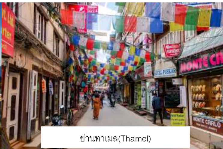
ย่านทามล(Thamel)